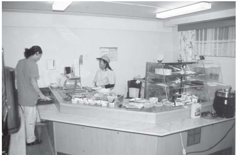
Úr starfsmannaborðstofunni á

álegg tvisvar í röð. Svona vandamál er erfitt að leysa fyrir þá sem komast ekki í borðstofurnar, en við reynum okkar besta og það ágæta fólk sem deilir út mat á deildunum. Annars má segja að mikið sé lagt upp úr góðu brauðmeti hér á Grund og hjá